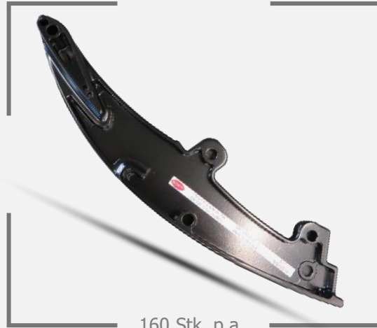
160 Stk. p.a.