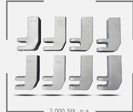
2.000 Stk. p.a.