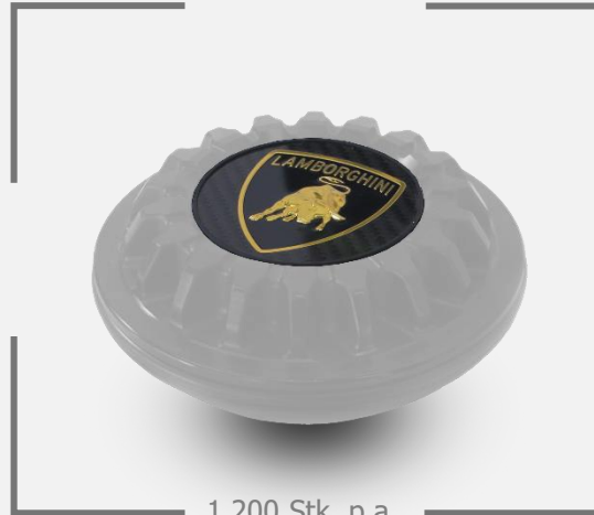
1.200 Stk. p.a.