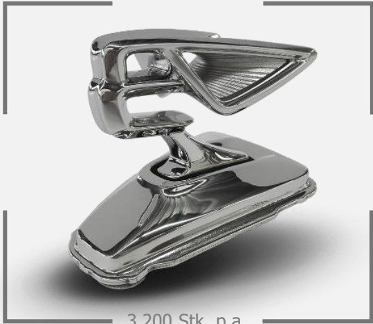
3.200 Stk. p.a.