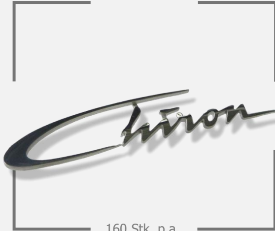
160 Stk. p.a.