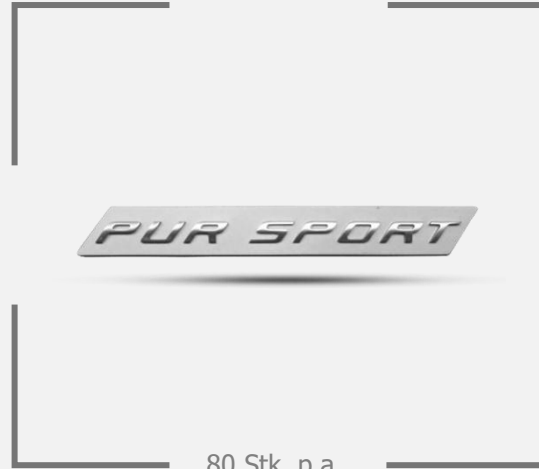
80 Stk. p.a.