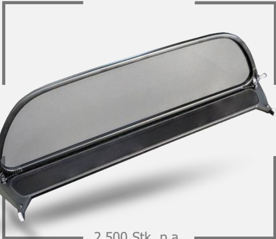
2.500 Stk. p.a.